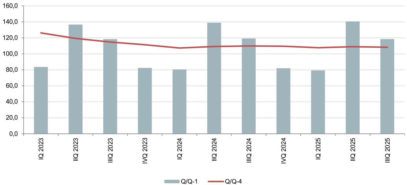
Grafik 1. Indeksi prometa u uslugama