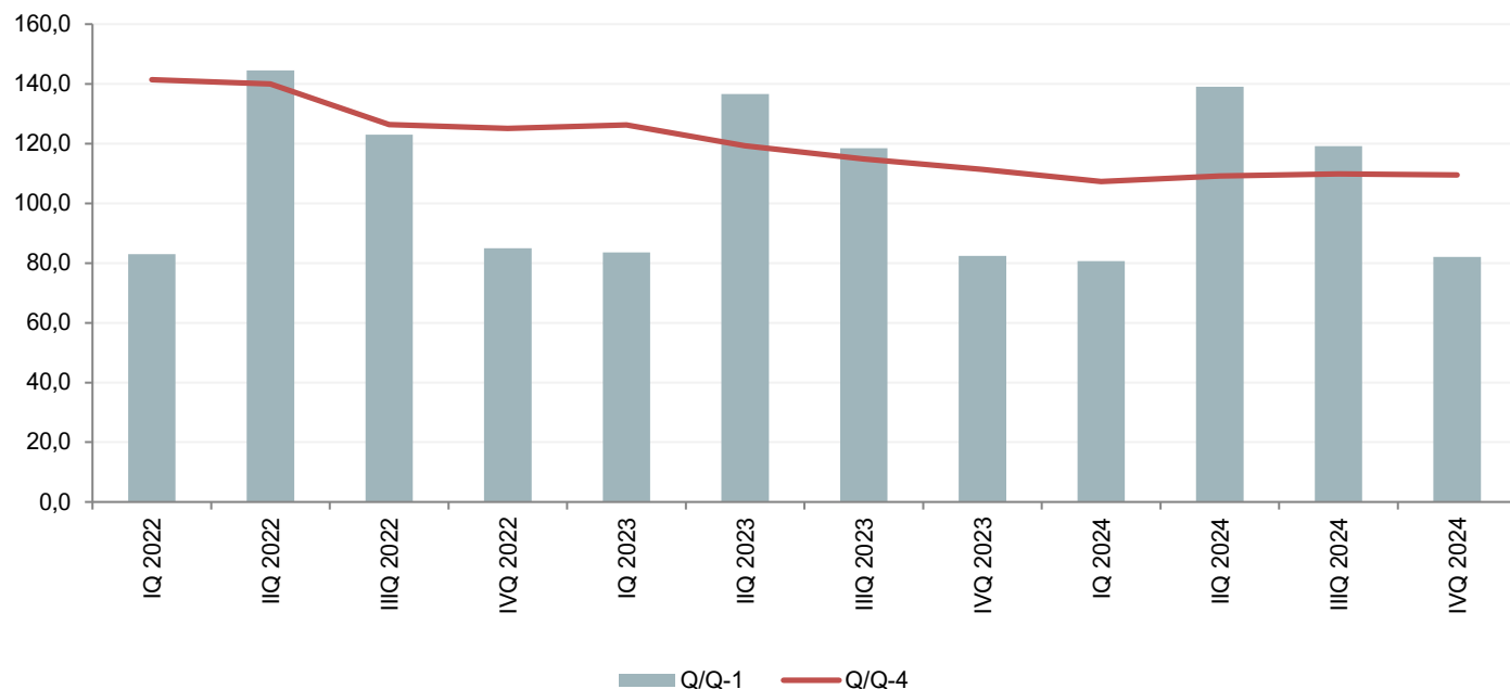
Grafik 1. Indeksi prometa u uslugama