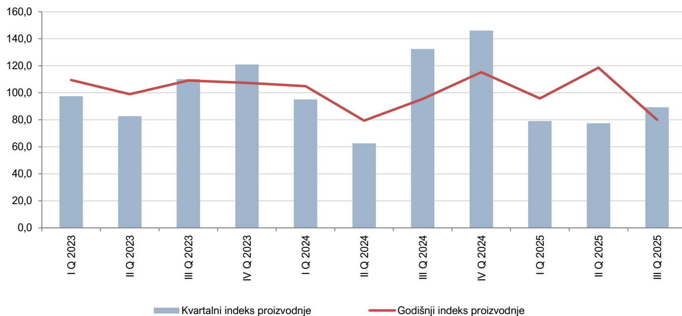
Grafik 1. Kvartalni i godišnji indeksi proizvodnje u industriji

❖ Kvartalni indeks proizvodnje – promjena proizvodnje u tekućem kvartalu u odnosu na prethodni kvartal